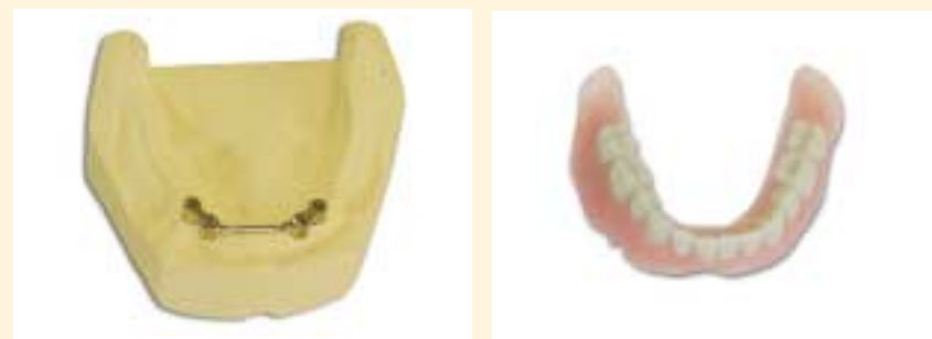
het vastzittend deel: de implantaten

implantaten ter sprake komen. Het ondergebit zit vaak te los omdat uw kaak ver geslonken is. Vaak is er dan geen hoogte meer aanwezig om het kunstgebit op vast te houden. Wanneer u ermee instemt om in de onderkaak implantaten te laten plaatsen, verwijst de tandprotheticus u schriftelijk naar de implantoloog met wie hij samenwerkt.